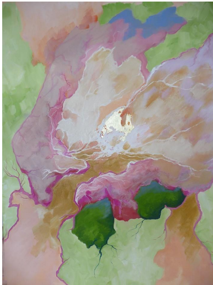
Emotie, olieverf 100x80 cm , 2011

Het zijn is ons aan het begin al gegeven en we moeten het “Zijn” laten zijn. Daarin zit aanvaarding, berusting en vrede. Overgave is moeilijk, daar is een groot vertrouwen voor nodig! Wij ervaren soms momenten van pijn, verdriet, maar ook van ongekennde vreugde, vanuit begrip over je leven en de zin ervan. We kunnen dan ook sterker in het NU gaan staan en meer bewust zijn van alles dat om je heen gegroeid is en wat dus bij jou hoort. (Eckhart Tolle, de kracht van het nu) Wanneer je autonoom kunt zijn en op het eigen innerlijke pad blijft, zoveel mogelijk in zelfstandigheid je geloof zoekt en vindt, sterkt het je persoonlijkheid. Dat bouwt standvastigheid.